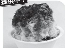
自家製ジャムシロップのかき氷