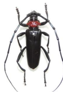
クビアカツヤカミキリ(成虫)