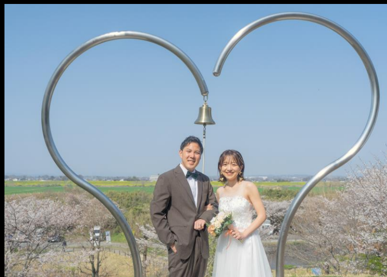
実際に前撮り・後撮り撮影を行った新郎新婦2組