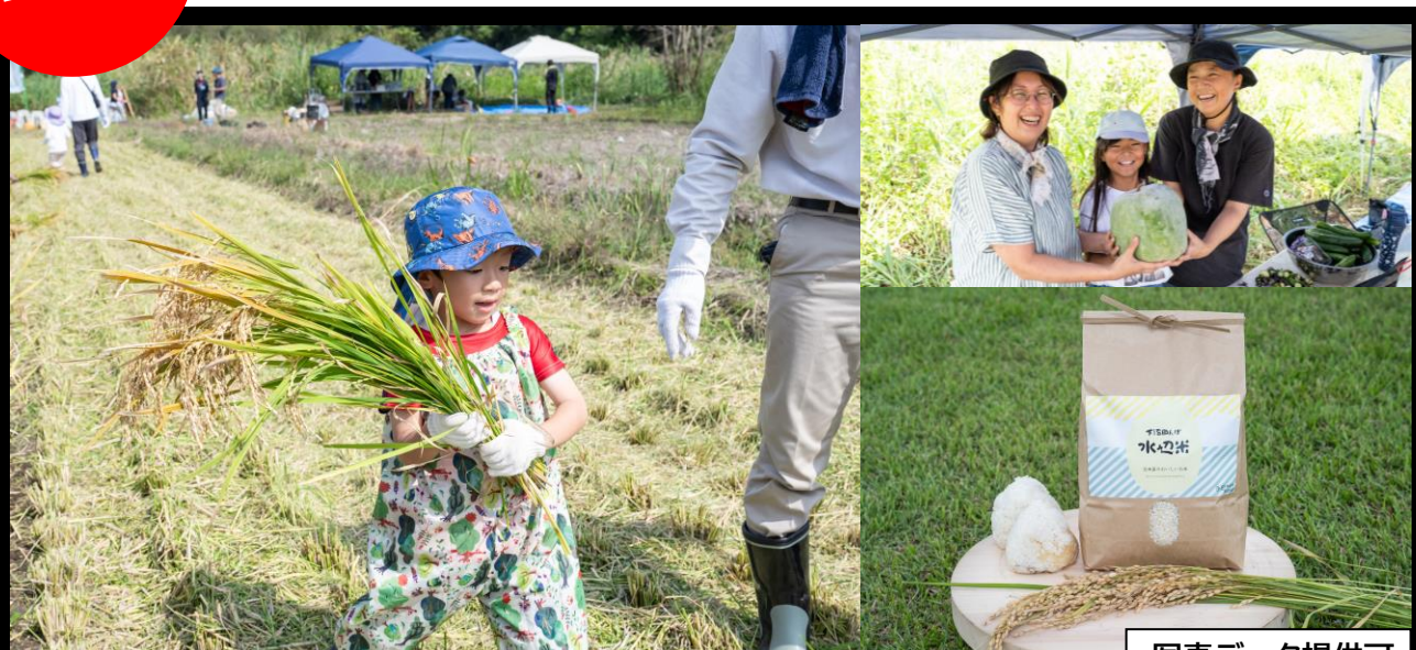
昨年の稲刈り体験の様子