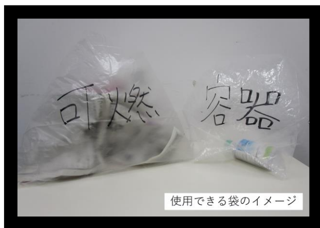
使用できる袋のイメージ