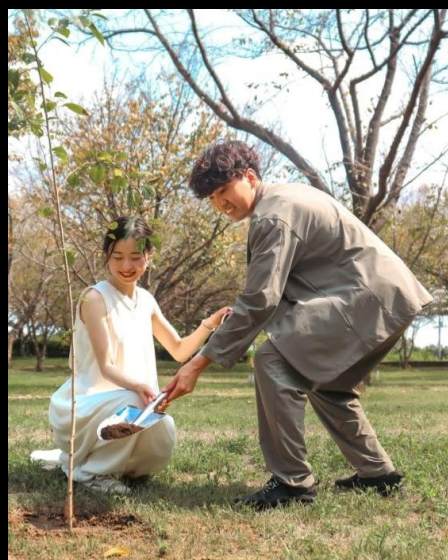
写真データ提供可

北本市では、表情豊かな公園を「特別な記念の場所」として活用してもらうため、昨年度よりパークウェディング事業を試行しています。昨年度は高尾さくら公園・水辺プラザ公園で前撮り・後撮りを希望する新郎新婦2組が撮影しました。今年度は 全ての公園で季節を問わず撮影が可能 となるよう拡大し、四季を通じた撮影を受け付けます。