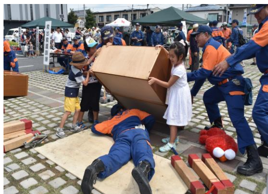
倒れた家具から人を救出する訓練の様子