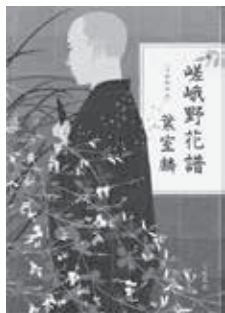
□ 嵯峨野花譜 葉室 麟 (文藝春秋)