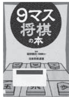
□ 9マス将棋の本 青野 照一 (幻冬舎)