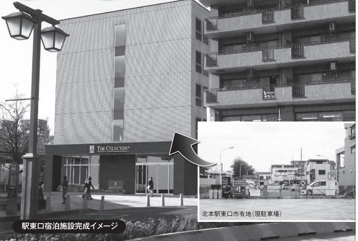
駅東口宿泊施設完成イメージ