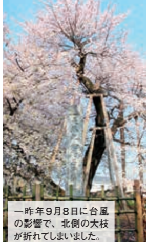
一昨年9月8日に台風の影響で、北側の太枝が折れてしまいました。

📍石戸宿3-119 📍あり[約120台] 北本駅から北里大学メディカルセンター行きバスで、「北里大学メディカルセンター」下車、徒歩約8分または「石戸蒲ザクラ入口」下車、徒歩約3分