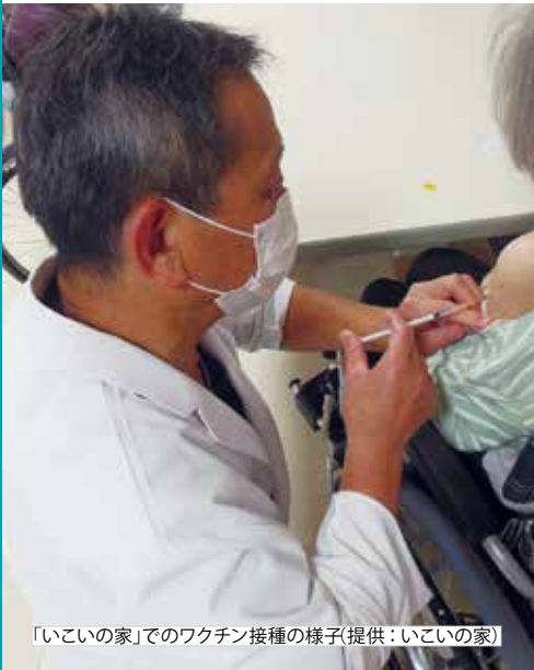
「いこいの家」でのワクチン接種の様子

医療従事者、高齢者施設等入所者につづき、5月26日から65歳以上の人のワクチン接種がはじまりました