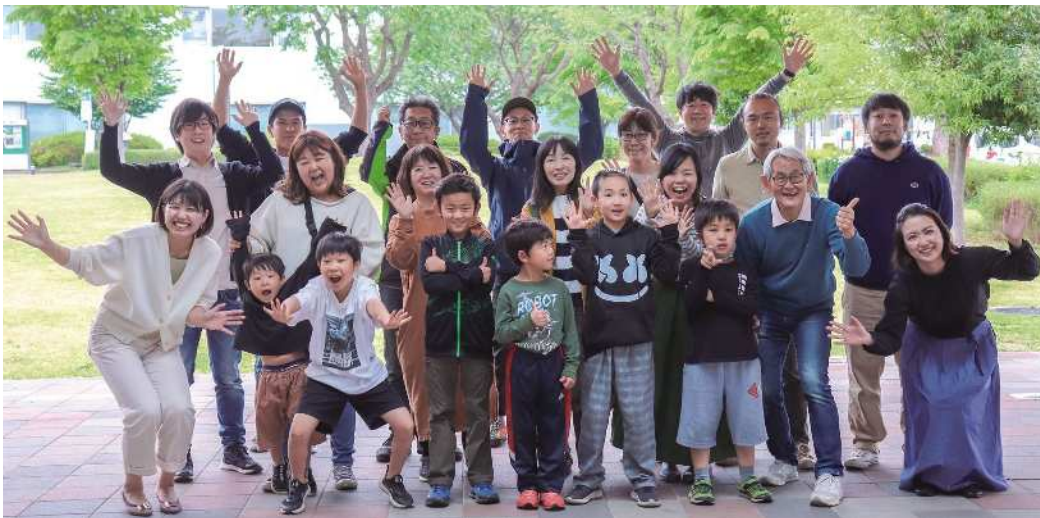
受賞の喜びにわく関係者と市民の皆さん