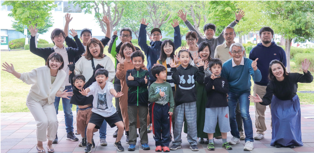
受賞の喜びにわく関係者と市民の皆さん