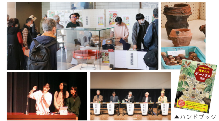
▲ハンドブックは市内外の書店で販売中

3月7日、文化センターで「デーノタメ遺跡が拓く縄文の世界IV-縄文の食文化に学ぶ-」が開催され、食文化や植物利用について、最新の調査研究が発表されました。出土品の展示や市民団体「デーノタメ縄文の杜プロジェクト」の紹介のほか、きたもと縄文みやげと、ハンドブック『1500年続いた縄文ムラ デーノタメ遺跡』の販売も行われました。当日は400人を超える来場者が、縄文人の暮らしや食文化、土器づくり実験などの取組みについて熱心に耳を傾けていました。