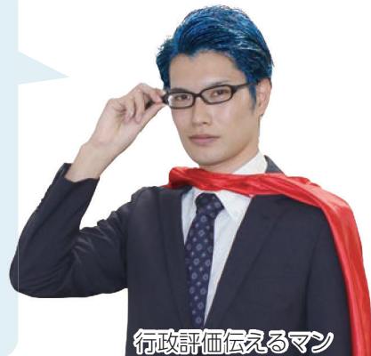
行政評価伝えるマン