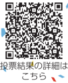
投票結果の詳細はこちら

市制施行 50 周年記念事業として、新たに「市の野草・野鳥・昆虫」を制定するため、市内に生息する候補（全 33 種）への一般投票および市の野草・野鳥・昆虫制定委員会による審査を実施し、下記の3種に決定しました。昭和 52 年に制定した「市の木」、「市の花」に加え、北本市に新たに3つのシンボルが誕生しました。