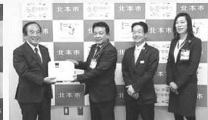
北本金融団様 武蔵野銀行北本支店様 東和銀行北本支店様 埼玉縣信用金庫北本支店様 プロジェクター、スクリーン

この他にも、多くの事業者や団体の皆様から記念品やお祝いのメッセージをいただきました。誠にありがとうございます。