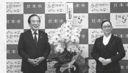
プラザオオノ有限会社様 胡蝶蘭