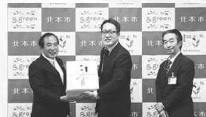
埼玉りそな銀行北本支店様 時計

北本市市制施行50周年のお祝いとして、各事業者等の皆様から記念品をいただきました。