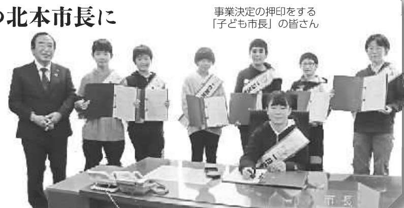
事業決定の押印をする「子ども市長」の皆様

12月27日、市内各小学校を代表した子どもたちが「一日北本子ども市長」に就任しました。市長から委嘱状を渡され「頑張ります」の元気な声で始まり、市役所の仕事の説明を受けたり、事業決定の体験をしたり、市役所の防災機能について学ぶなど、市長の仕事を体験しました。