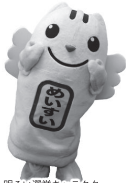
明るい選挙キャラクター 選挙のめいすいくん