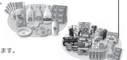
<選べるギフトのセット例>