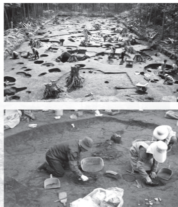
森の下から姿を現した縄文時代中期のムラ

関東最大級のムラ デーノタメ遺跡は下石戸下地区にあり、市内を流れる江川の支流に面しています。遺跡の面積は約6ヘクタール。市内最大の深い森に覆われ、遺跡は静かに眠っています。ちなみに、「デーノタメ」とはかつて遺跡の北部にあった湧水池のこと。縄文時代には生活を支える豊かな水源であったことでしょう。