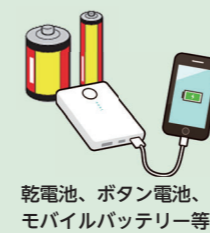
乾電池、ボタン電池、モバイルバッテリー等