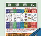
毎月1回目の資源回収へ