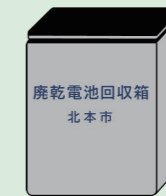
公共施設等の回収場所へ