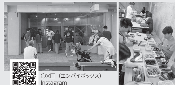
OX□ (エンバイボックス) Instagram