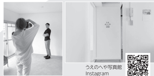
うへのへや写真館 Instagram