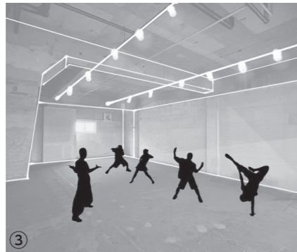
① KILIG DANCE SCHOOL のメンバー ② KILIG DANCE SCHOOL の生徒の皆さん ③ スタジオの完成イメージ。1階は広々としたダンススタジオ、2階はマッサージや座学に利用できるスペース。

以外の自分の居場所として、毎週楽しみに通ってくださる生徒さんがたくさんいます。いち習い事ではありませんが、ダンスの力で、北本を盛り上げたい！ 私たちはそう考えています。皆様のご支援をどうぞよろしくお願いたします。