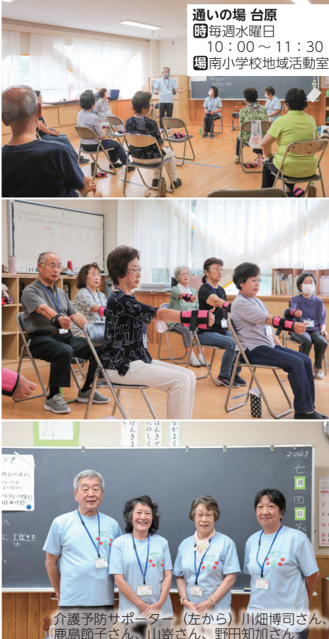
通いの場 台原 ☎毎週水曜日 10:00～11:30 場南小学校地域活動室