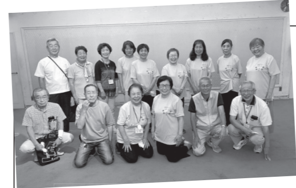
音楽セラピーイベントでとまちゃん体操を紹介した介護予防サポーターの皆さん

自分に合った負荷で取り組めることはもちろん、仲間と共に体を動かし、外出機会を増やすことも、体操の場に通うことの魅力です。私たち理学療法士も、北本市を元気なまちにするために、体操の指導やイキイキと生活を送るための秘訣を伝授しています。皆さんの通いの場にもお邪魔しますので、よろしくお願いいたします！