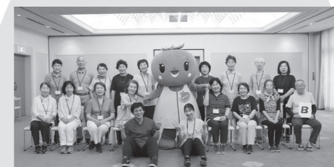
今年の養成講座を修了し、介護予防サポーターとなった皆さん

毎年開催している「介護予防サポーター養成講座」では、全8回、2か月の講座で、イキイキとまちゃん体操や介護予防について、座学やワークを通して学べます。修了すると修了証とサポーター用名札が授与されます。来年も開催予定です！