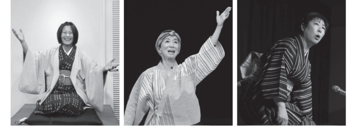
焼酎亭カシス 焼酎亭どら こまち亭しらたき

時 12月3日(日) 14:00~16:00 出演 焼酎亭カシス、焼酎亭どら、こまち亭しらたき 内 華やかで賑やかな3人が登場。落語をはじめ、パントマイムや腹話術など笑いの魅力にあふれた芸を披露。 定 100人 費 【全席自由】前売:1,200円 申 文化センター窓口にて発売中。