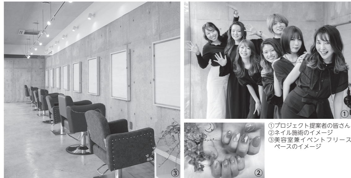
①プロジェクト提案者の皆さん ②ネイル施術のイメージ ③美容室兼イベントフリースペースのイメージ

「美容で皆が元気になれる場所をつくりたい」 美容を学べる・体験できる スクールプロジェクト