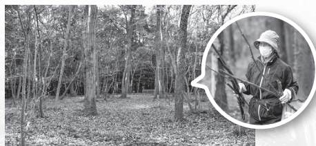
整備されたデノタメの森

縄文人が利用した植物資源の情報の豊富さは、デノタメ遺跡の特色です。デノタメの森が、これからも市民の様々な文化活動でにぎわっていくことを願っています。