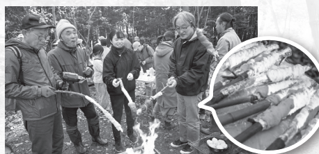
マテバシイの棒巻きパンを焼く皆さん

*森の整備の様子や市民グループのインタビューを、広報きたもと令和5年12月号特集「デノタメ遺跡は今」で紹介しています。ぜひご覧ください。広報きたもと令和5年12月号▶