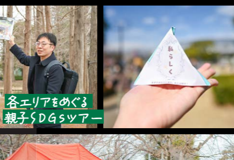
各エリアをめぐり 親子SDGsツアー