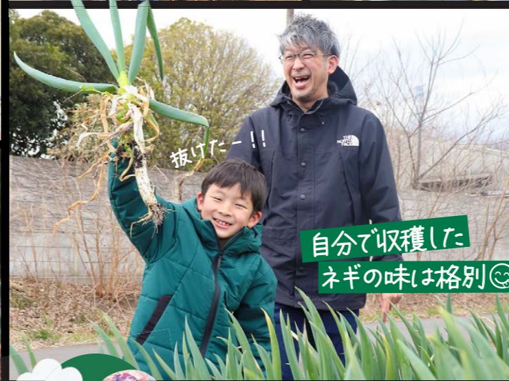
自分で収穫した ネギの味は格別😊