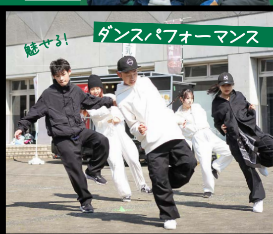
魅せる！ ダンスパフォーマンス