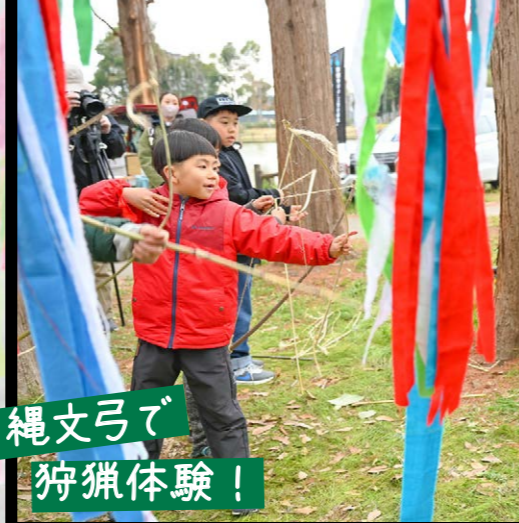
縄文弓で 狩猟体験！