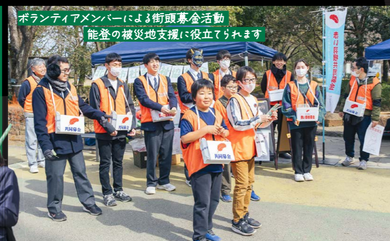
ボランティアメンバーによる街頭募金活動 能登の被災地支援に役立てられます