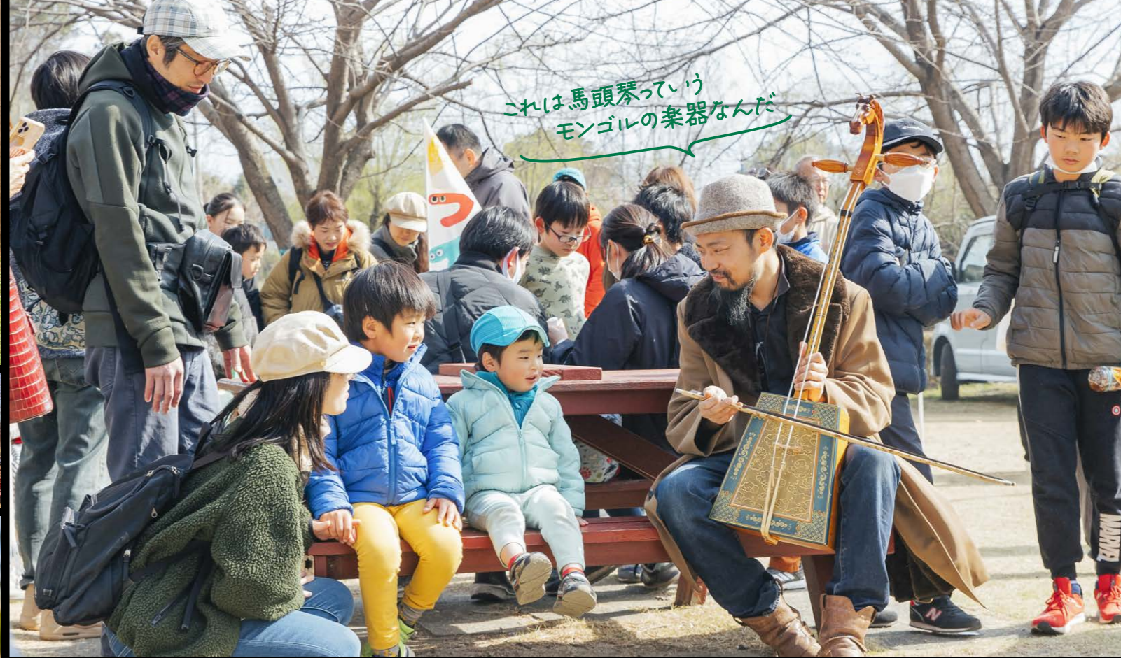
これは馬頭琴っていう モンゴルの楽器なんだ