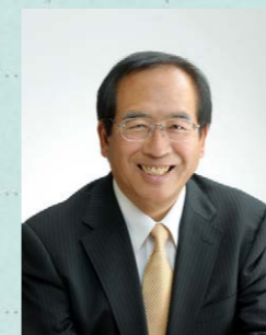
北本市長 三宮 幸雄

令和6年度は、本市の強みである地域資源を活かした持続可能なまちづくりを図るため、第五次北本市総合振興計画に掲げた重点基本事業を着実に推進しつつ、「子育てしやすいまちづくりの推進」、「魅力あるまちづくりの推進」、「持続可能なまちづくりの推進」の3つの方針を重点に取り組んでまいります。