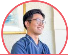
機能訓練指導員 （理学療法士など）

施設で利用者の入所や生活に関する相談・指導を行うほか、関係機関との連絡・調整も担います。