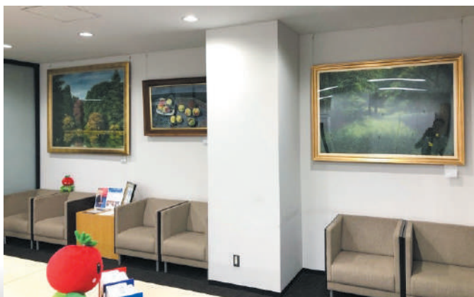
左奥：「初秋」 右手前：「名もなき森」(作・山本貞)