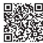
▲大村記念館 ホームページ

また、北里大学メディカルセンターの敷地内にある絵画や大村博士関連の展示を行う大村記念館(荒井6-102)では、大村博士のノーベル生理学・医学賞受賞10周年を記念した特別展が3月30日(月)まで開催されています。さらに迫力のある大きな絵画が展示され、また、大村博士の偉業を紹介したブースの特別展示が行われています。観覧は無料。こちらもぜひ、足を運んでみてください。