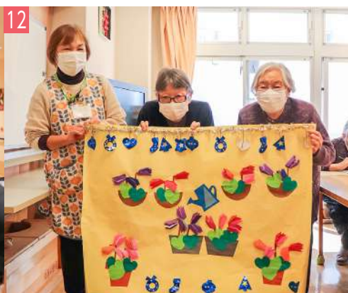
12 コープみらい北本デイサービスセンター デイ 下石戸下 1512-1 / ☎ 590-5866 地域密着型通所介護 笑顔あふれる居心地のよいアットホームな職場です