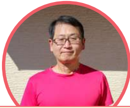
介護職員 （介護福祉士など）

「介護」とは、高齢や心身の障がいなどにより日常生活に支障がある人に対して援助などを行うこと全般を意味します。そのお仕事の一部を紹介します。