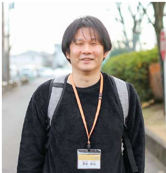
管理者（兼オペレーター兼訪問介護員）