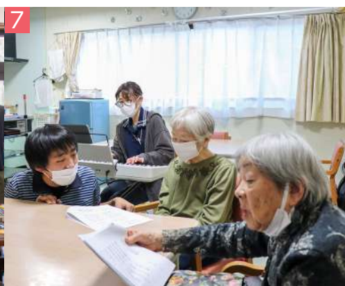
7 あすなるホーム北本 デイホーム 中丸 4-51-5 / ☎ 593-4150 (介護予防) 認知症対応型通所介護、 (介護予防) 認知症対応型共同生活介護 笑顔と音楽と介護の力は無限大！