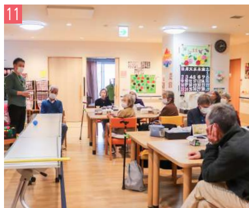
11 小規模多機能ホームコープ夢みらい北本 小多機 下石戸下 1512-1 / ☎ 501-5668 (介護予防) 小規模多機能型居宅介護 いつも笑顔あふれる働きやすい職場です！