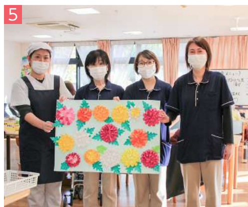
5 デイサービスセンター北本 デイ 緑 3-16 / ☎ 590-5640 地域密着型通所介護 いきいき笑顔時間を提供します！