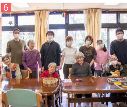
6 グループホーム北本 ホーム 緑 3-16 / ☎ 590-5630 (介護予防) 認知症対応型共同生活介護 入居者様・家族様の安心を支援します