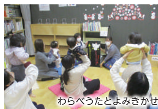
わらべうたとよみきかせ