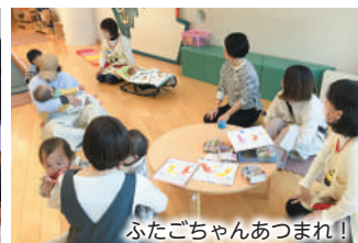
ふたごちゃんあつまれ!!