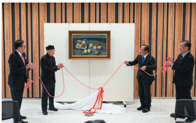
貸与式でお披露目された絵画