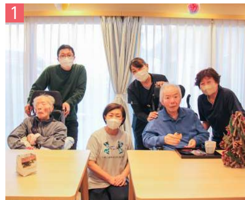
1 看護小規模多機能ケアみらい 小多機 東間 6-106-3 / ☎ 501-5011 看護小規模多機能型居宅介護 和気あいあいアットホームな楽しい職場です