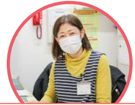
生活相談員 （社会福祉士など）

利用者に必要な介護サービスを総合的に判断し、介護サービス計画（ケアプラン）を作成します。