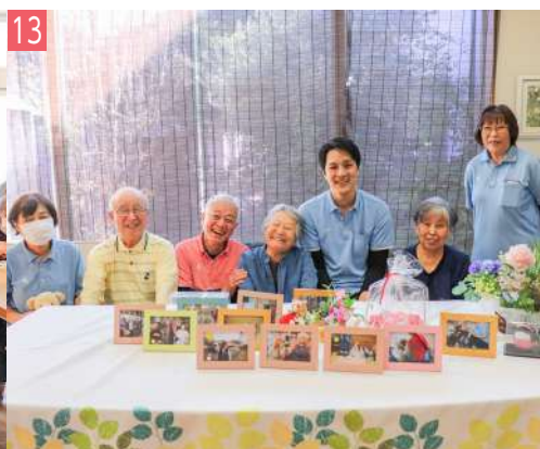
13 北本ひまわりケアサポート ホーム 小多機 中丸 7-52-1 / ☎ 577-3133 (介護予防) 小規模多機能型居宅介護、 (介護予防) 認知症対応型共同生活介護 「本人らしさ」を尊重できる施設です！