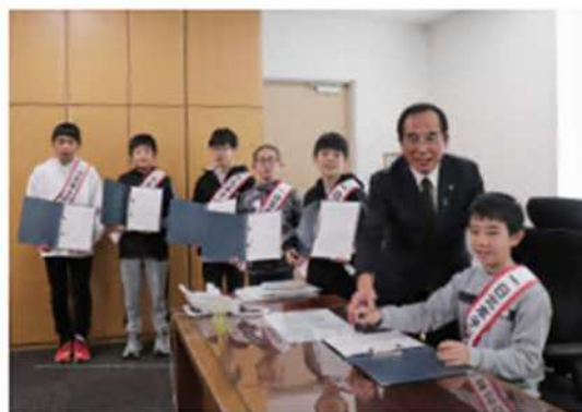
昨年度の決裁体験の様子