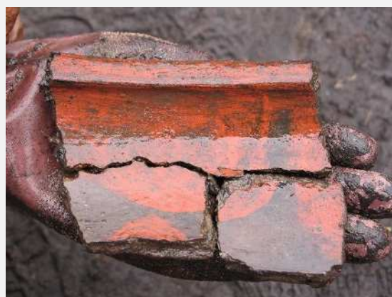
土器の発掘風景(左)と出土した漆塗土器(右)