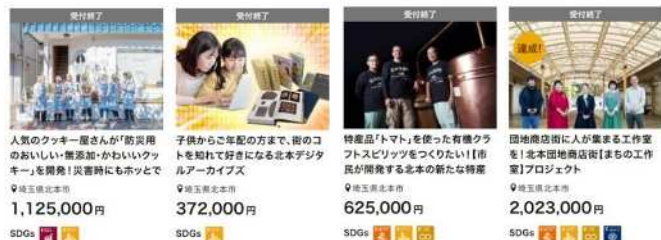
【ふるさと納税型クラウドファンディング】