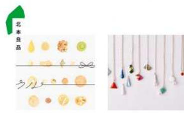
【ふるさと納税返礼品】クッキー 専門店クルのクッキー 【ふるさと納税返礼品】Kenichi Kondo 7周年作品 【シティプロモーションサイト「&green」】