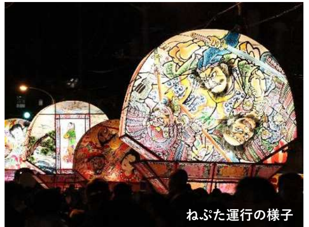
ねぶた運行の様子