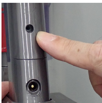
③ビス留めは行わない