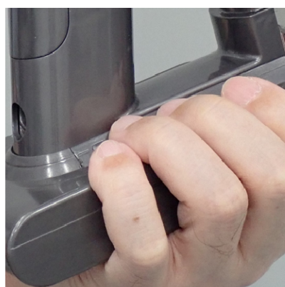
④手のひらをバッテリー底面、指をバッテリー上面にあてがう