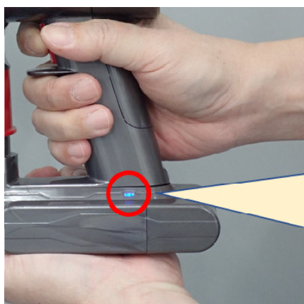
⑤バケツの上で、電池切れになるまで掃除機を運転

運転中、パイロットランプは「点灯」します。電池切れになると、パイロットランプが「点滅」状態になります。