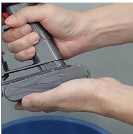
②バッテリーを掃除機に装着