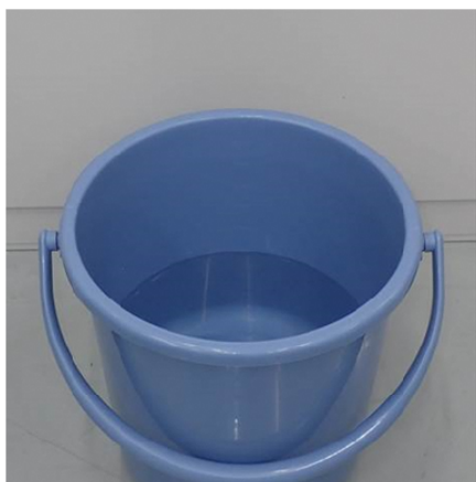
①水を張ったバケツを準備