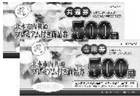
販売されたプレミアム付き商品券

この事業実施により、市内での消費の促進を喚起し、地域経済の活性化への起爆剤となること、また市内商業者においても会員以外からの申し込みがあるなど商品券の発行の効果には大いに期待が出来ます。今後は市内商店会や個店が魅力