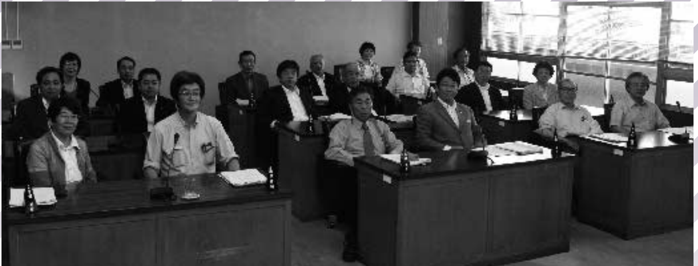
議場の様子(市議会議員20名)