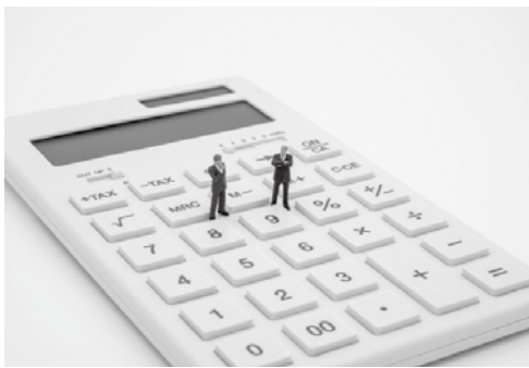
議長454,000円、副議長391,000円、常任・議会運営委員長379,000円、議員372,000円になります。

A 総務部に職員課を新設するとともに、人権推進課を廃止し、人権推進・男女共同参画担当を総務課へ編入する改正を行います。従来の総務課の職員担当は給与や勤怠、任命、服務などの管理事務が中心でしたが、働き方改革や制度改正、採用難、メンタルヘルス対応など業務領域が拡大しているこ