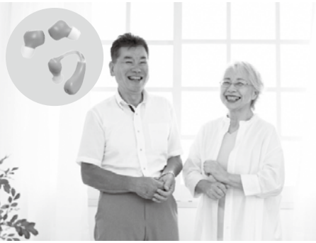
難聴者補聴器購入費助成事業は、5月1日(金)から助成を開始します。

A 史跡の公有地化は、国指定史跡を確実に保存するためのもので保存活用計画の策定を前提とするものではありません。私有地のままでは地権者の承諾手続や事務負担が大きく、相続等により保存が困難となるおそれがあります。また文化庁補助制度の補助率が80%