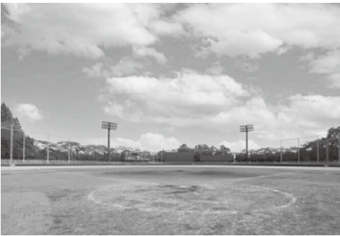
総合公園のテニスコート、多目的広場、野球場等の利用料金の上限額が変更になります。

子育て世帯に対する支援を目的とした「子ども・子育て支援金制度」の創設に伴い、令和8年度から、北本市国民健康保険においても、従来の「医療給付分」、「後期高齢者支援金分」、「介護納付金分」に加えて「子ども・子育て支援納付金分」の徴収が必要となりました。