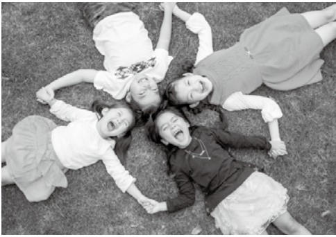
「子ども・子育て支援金」は、児童手当の拡充や妊婦のための支援給付等に充てられます。