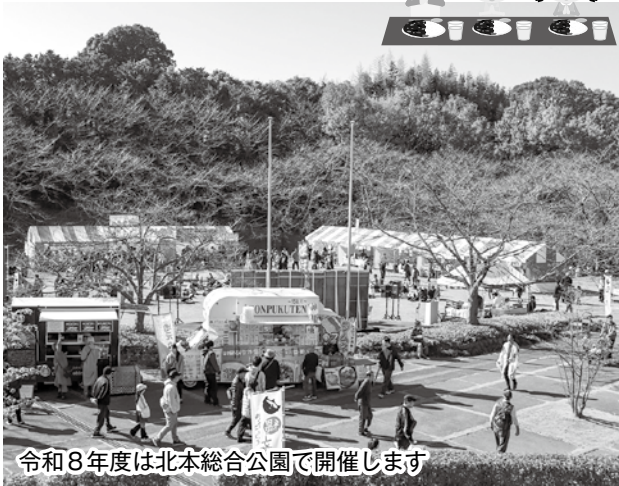
令和8年度は北本総合公園で開催します