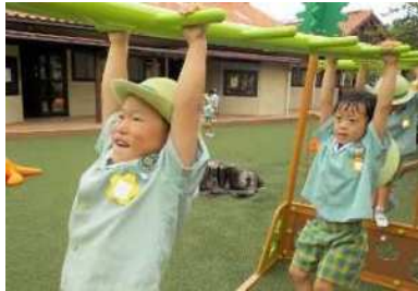
健康で元気に活動することも

《教育目標》・・・学校法人として50年以上続く「森の詩幼稚園」の教育目標と同様です。