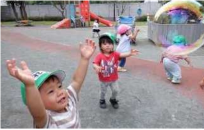
健康で元気に活動することも

《教育目標》・・・学校法人として50年以上続く「森の詩幼稚園」の教育目標と同様です。