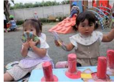
自分で考えて行動することも