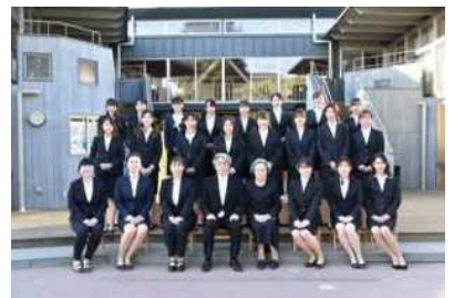
若く元気あふれる教職員