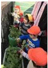
ラディッシュの収穫