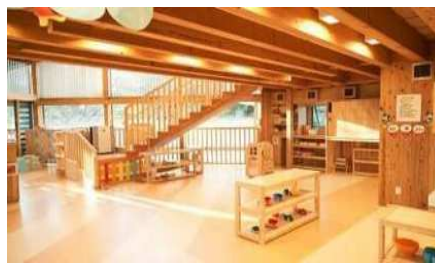
木空間あふれる保育室