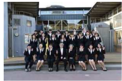
若く元気あふれる教職員