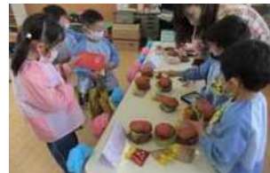
(おみせやさんごっこ)