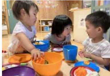
友達と仲良く遊べることも