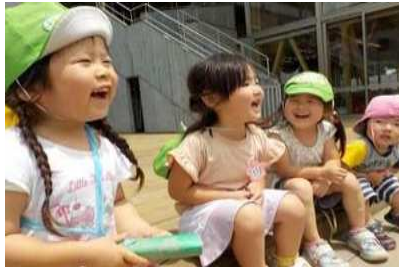
友達と仲良く遊べることも