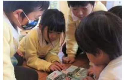
自分で考えて行動することも