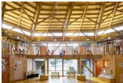
木空間あふれるホール