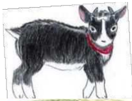
山羊のりぼんちゃん

～人間性を育てる幼児教育～ 本園では子ども達の心と体を、豊かな自然の中で時間をかけてしっかりと育てていきたいと考えています。豊かな感性を基盤として、幼児期の楽しさを十分に味わって、意欲と思いやりの心を大切に育てていきます。