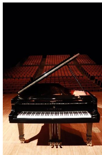
コンサート用グランドピアノ スタインウェイ：D-274