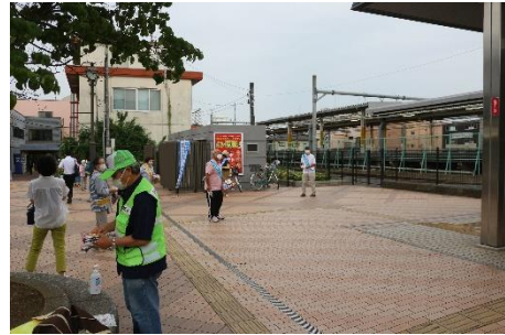
非行防止キャンペーン