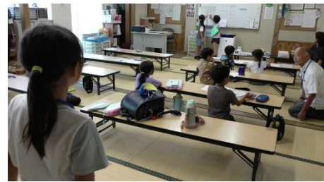
放課後子ども教室