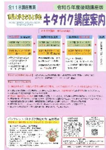
キタガク講座案内