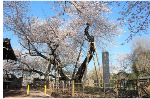
石戸蒲ザクラ（国指定天然記念物）