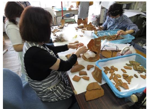
出土した遺物の整理作業