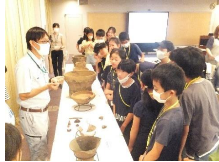
学習支援（子ども大学きたもと）