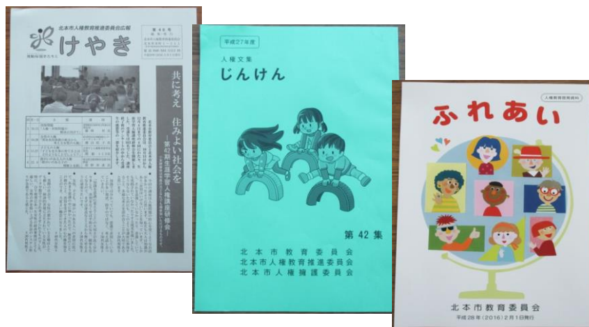
人権文集「じんけん」、人権教育啓発資料「ふれあい」、 北本市人権教育推進委員会広報「けやき」