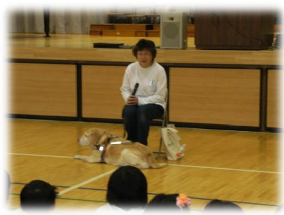
小学校4年生 総合的な学習 福祉体験（車いす体験・盲導犬集会）