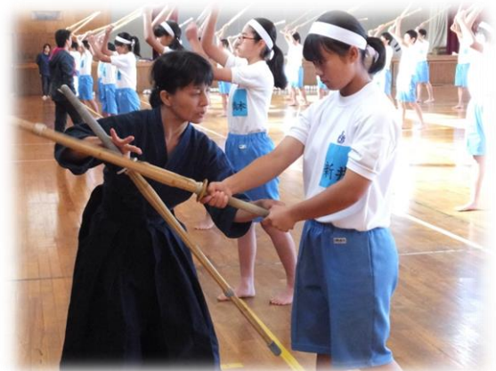
武道（柔道・剣道）の外部指導者と中学校保健体育教員との授業