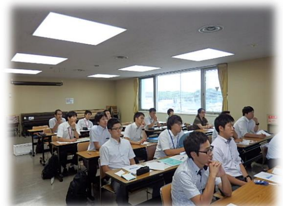
体力向上進推講演会