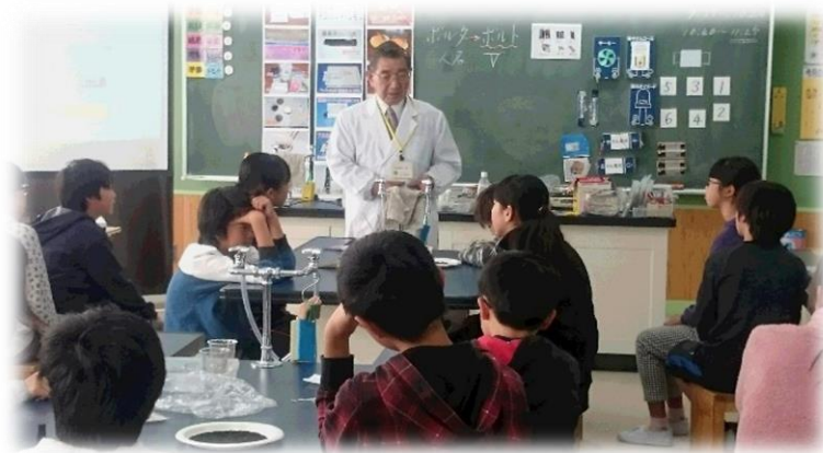
こころの教育推進事業「こころの授業」における専門的な授業の実施の様子