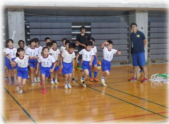
児童を対象とした運動教室