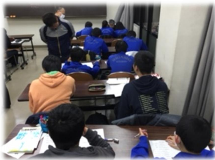
北本市営ナイトスクールの様子