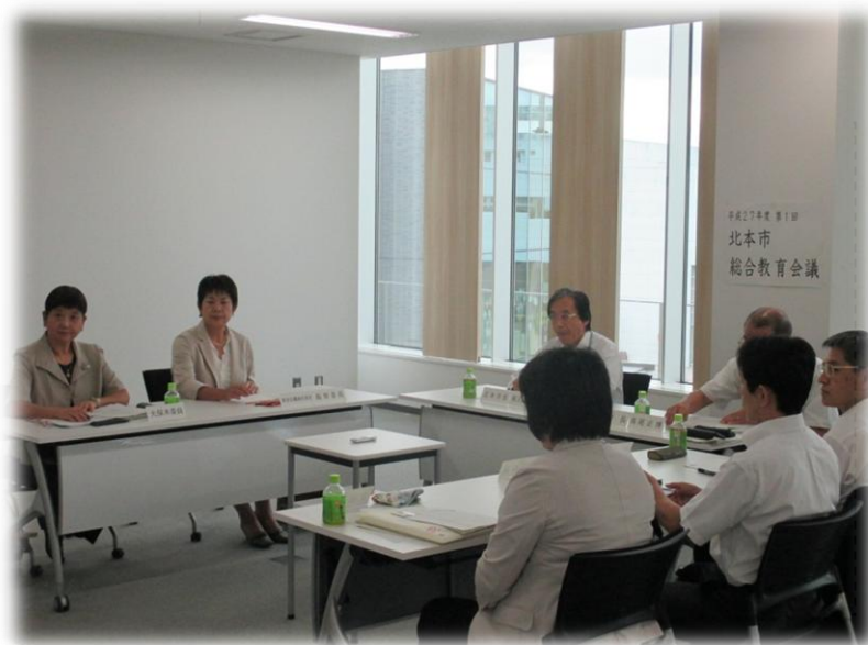
平成27年度第1回総合教育会議の様子