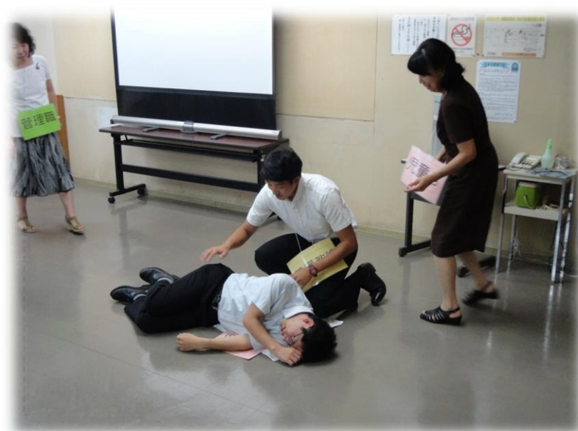
～アナフィラキシーショック対処の演習～