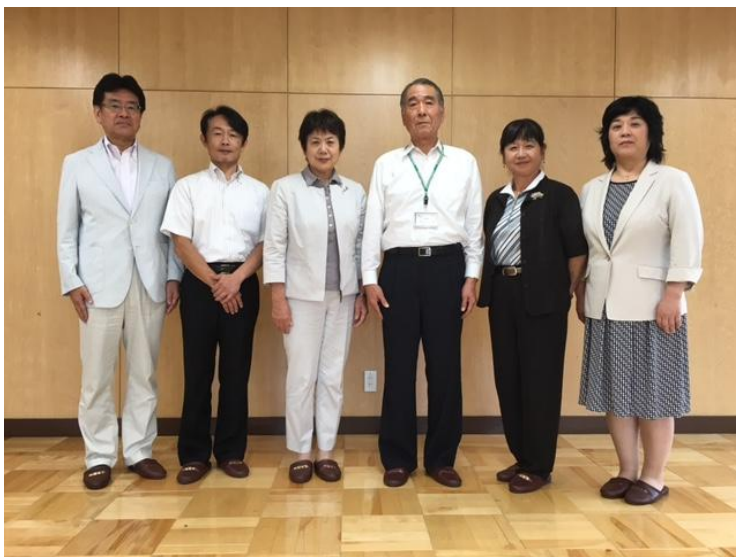
教育委員会委員名簿