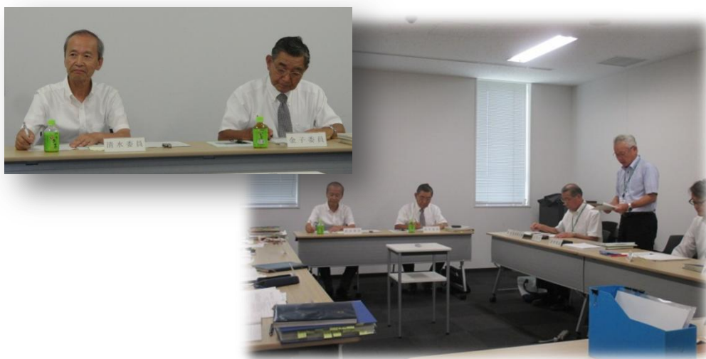
～教育委員会の事務に関する点検及び評価 外部評価会の様子～

北本市教育振興基本計画も実施されて3年目を迎え、教育行政全般に亘り、適正な管理及び運営が図られており、各課の施策においても、すべての施策において期待どおり又は期待以上の成果を挙げている。ことに、「安全教育の推進と安全管理の徹底」、「学校4・3・2制（小中一貫教育）や異校種間連携の推進」、「地域の教育推進体制の充実」、「生涯学習のまちづくりの推進」等の施策においては、特に顕著な成果を挙げている。全般に亘り、教育委員会の自己評価も妥当と思われる。今後は、各課で設定した目標の達成に向けたさらなる取組と推進が図られることを期待したい。