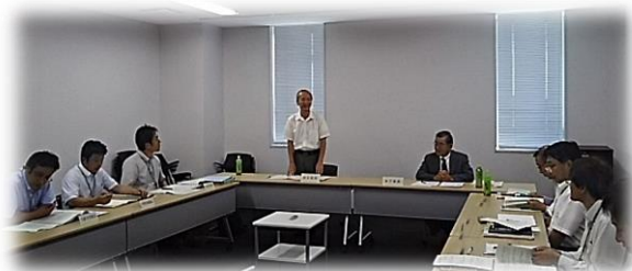
～平成29年度 外部評価会の様子～

今後は、5ヵ年計画のまとめとして、各課で設定した施策の数値目標の達成に向けた、さらなる取り組みに期待したい。