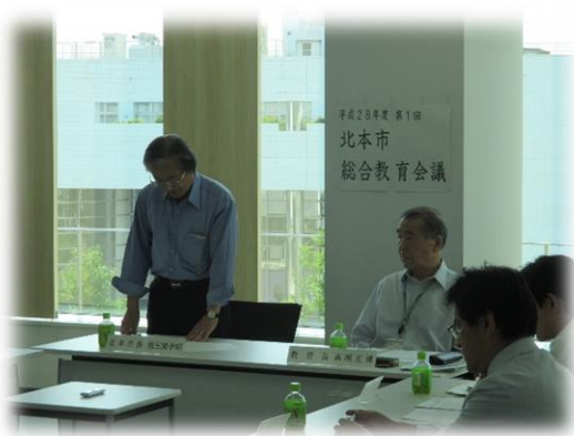
平成28年度第1回総合教育会議の様子