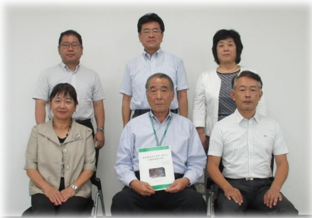
教育委員会委員名簿