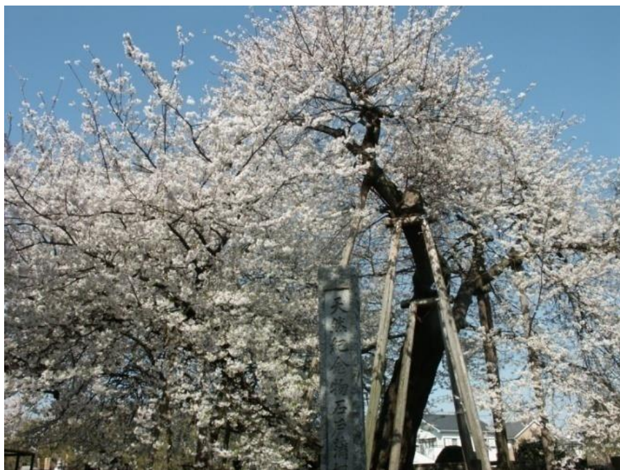
国指定天然記念物 石戸蒲ザクラ