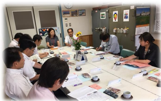
平成29年度教育委員学校訪問の様子