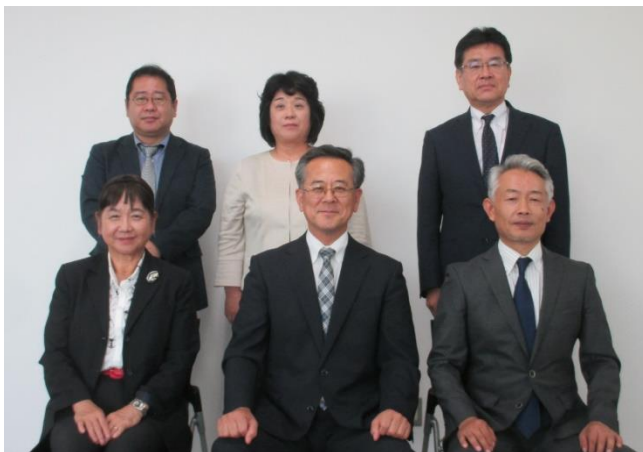
教育委員会委員名簿