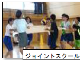
ジョイントスクール