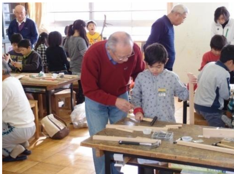
学校応援団 * のゲストティーチャー