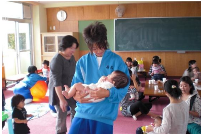
地域活動室 * での交流