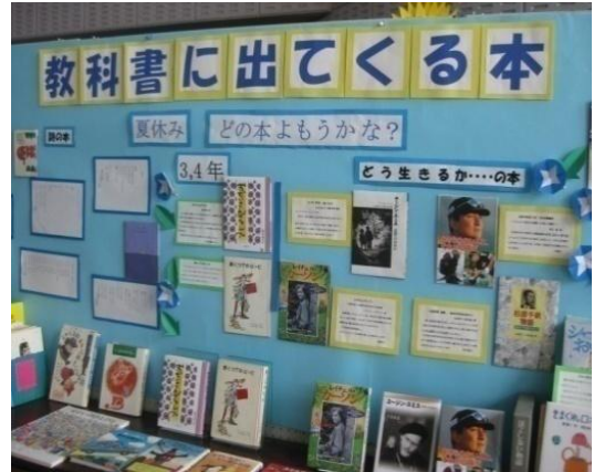
おすすめ本の展示