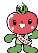
けんこう大使 とまちゃん

《お問い合わせ先》 一北本市役所保険年金課 後期高齢者医療担当一 ☎048-594-5542（直通）