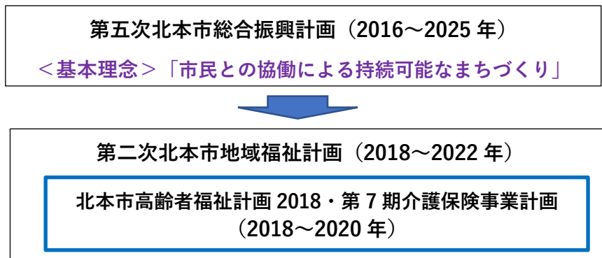
図 1. 北本市高齢者福祉計画 2018・第 7 期介護保険事業計画の位置づけ