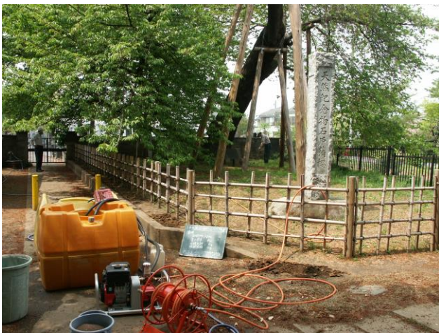
水タンクとコンプレッサー