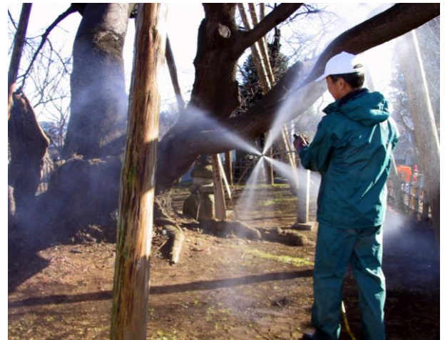
灌注ステッキの噴射状態