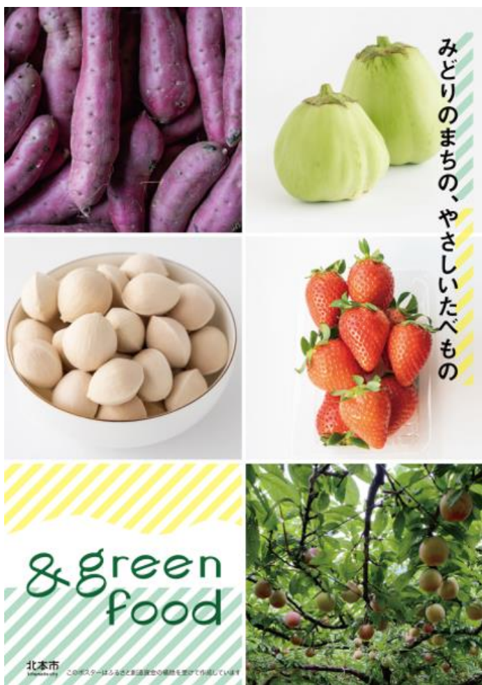
・図５・・・ポスター