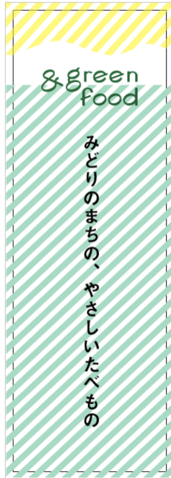
・図2・・・のぼり旗 (60cm×180cm)