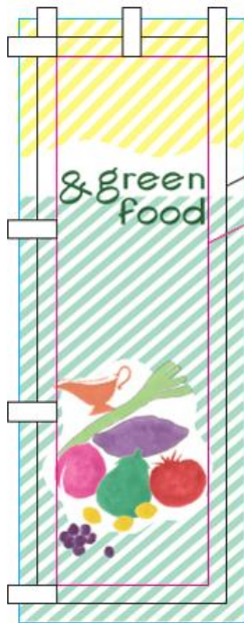
・図1・・・卓上のぼり旗 (10cm×30cm)