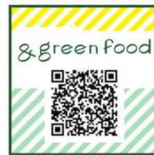
四角いシールの場合

QRコードなどでweb上の情報と連動させて、生産者のこだわり、 オススメの食べ方などを伝えるような使い方もできます。