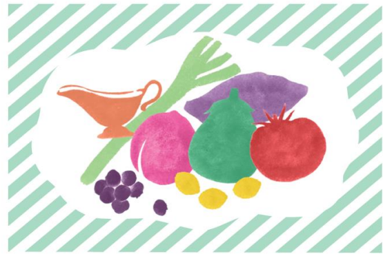
・図10・・・サブグラフィック