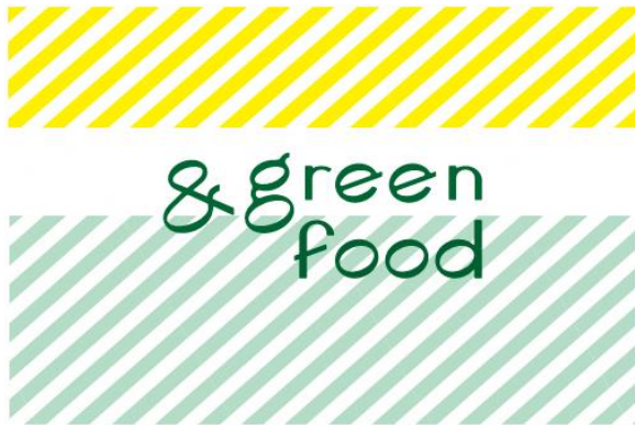
・図9・・・ブランドシンボル