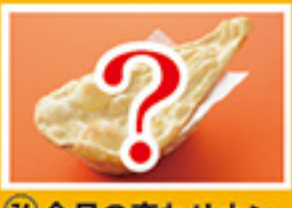
⑥⑭ 今月の変わりナン 499円