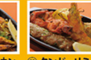
⑧⑦ タンドーリブラウン 2pc 599円