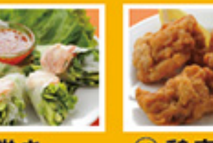
⑧⑫ 生春巻き 690円