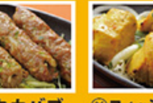
⑧⑤ シークカバブ 2pc 449円