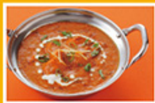
⑤④ チキンティッカマサラ 979円