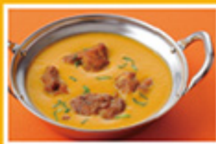
⑤⑤ チキンマサラ 849円