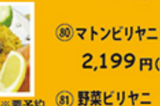
⑥⑲ チキンビリヤニ ※要予約 2,099円(2人前)