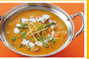
⑥⑪ ミックス野菜 829円