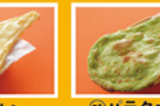
⑥⑪ バターナン 499円