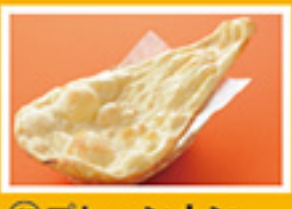
⑥⑦ プレーンナン 270円