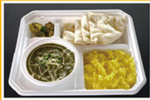
⑤① ナン&カレーライス弁当