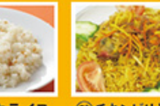
⑥⑱ ガーリックライス 499円