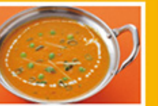
⑥⑫ キーママサラ 849円