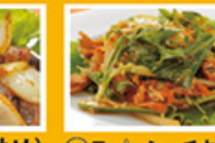
⑧⑭ ホタ(砂肝炒め) 599円