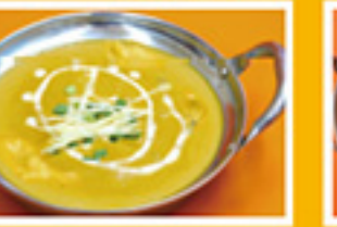
⑥⑬ ミックスシーフード 949円