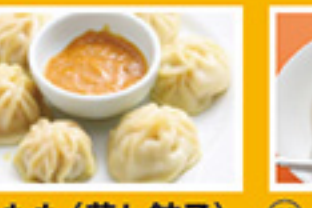
⑧⑩ もも(蒸し餃子) 599円