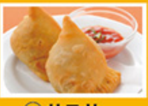
⑧⑨ サモサ 2pc 449円