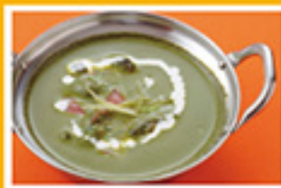
⑤⑥ バラクチキン 899円