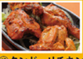
⑧② タンドーリチキン 2pc 450円