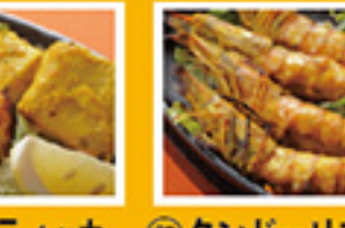
⑧⑥ フィッシュティッカ 2pc 599円