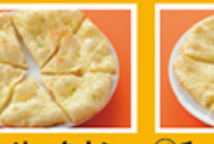
⑥⑨ ガーリックナン 449円