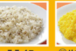
⑥⑯ ジーラライス 450円