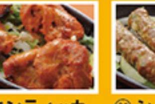
⑧④ チキンティッカ 2pc 399円