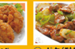
⑧⑬ 鶏唐揚げ 499円