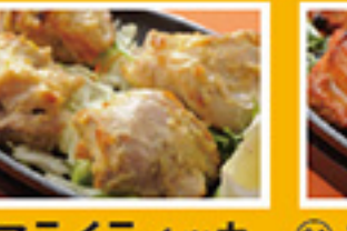
⑧③ マライティッカ 2pc 399円