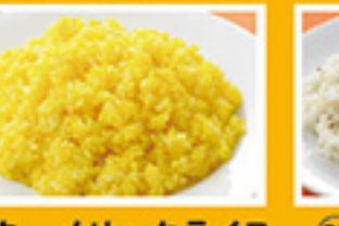
⑥⑮ ターメリックライス 299円