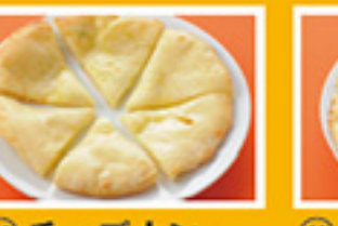
⑥⑧ チーズナン 499円