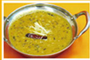
⑥⑩ ダル(豆)タルカ 829円