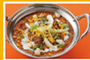
⑤⑨ マトンマサラ 979円