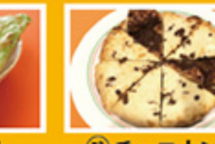
⑥⑫ バラクナン (ほうれん草のナン) 499円