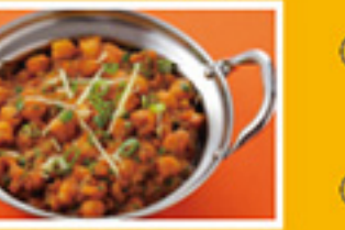
⑥⑭ チャンマサラ 929円