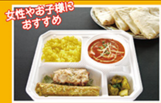
⑤③ バターチキン・チーズナン弁当