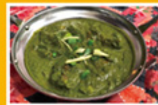
⑤⑧ バラクマトン 949円