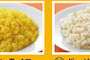
⑥⑰ サフランライス 499円