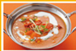
⑤⑦ バターチキン 979円