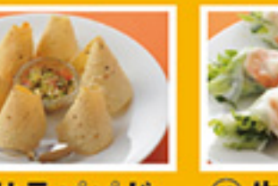
⑧⑪ マサラパバド 399円