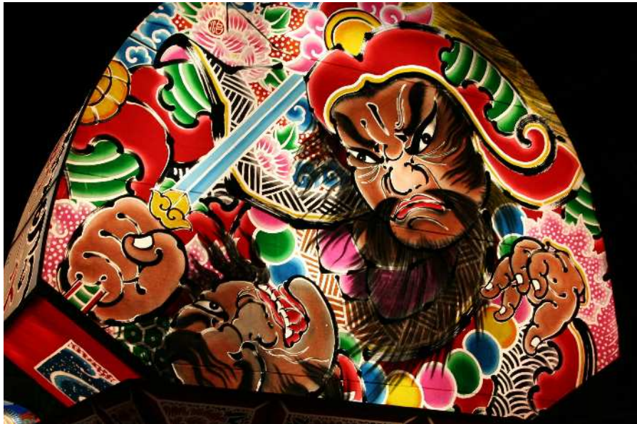
北本まつり「宵まつり」～範頼ねぶた