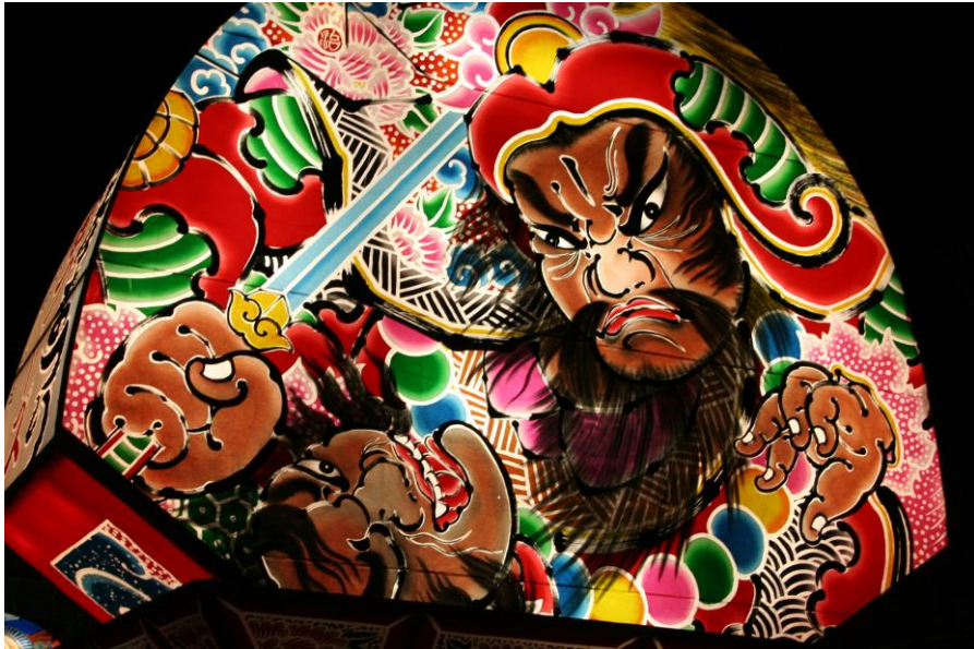
北本まつり「宵まつり」～範頼ねぶた