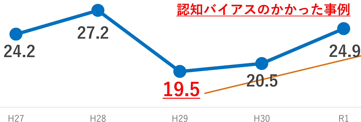
施策6-1 市政に意見が反映されていると思う市民の割合 (%)