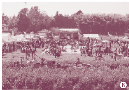
⑧菜の花まつり会場

市内のあちらこちらで桜が咲き誇り、菜の花がまちを彩ります。 きたもとの春が今年もあなたを待っています。