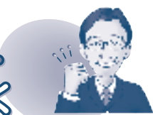
北本市長 石津 賢治

荒川河川敷の「水辺プラザ」が完成しました。「水辺プラザ」は、荒川の親水拠点として国土交通省と北本市が一体となって整備を進めてきた公園整備事業で、かつての荒川の流れを模した旧流路体験水路や広大な芝生広場、市が整備した駐車場など約4.1ヘクタールもの広さがあります。園路を行くと荒川に近づくことができ、力強い川音とダイナミックな流れが体感できます。