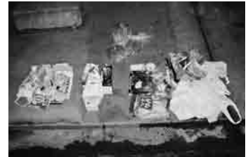
指定袋の中の状況