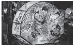
平成23年「弘前ねぶた」