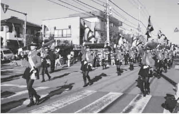
カラーガード隊のフラッグ演技