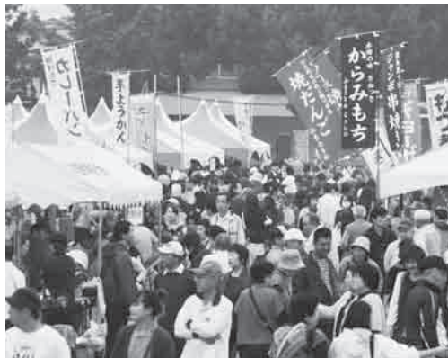
産業まつりの様子

当初より、市民による、市民のまつりとして、市内で活動する各種団体等で「実行委員会」を組織して運営されています。