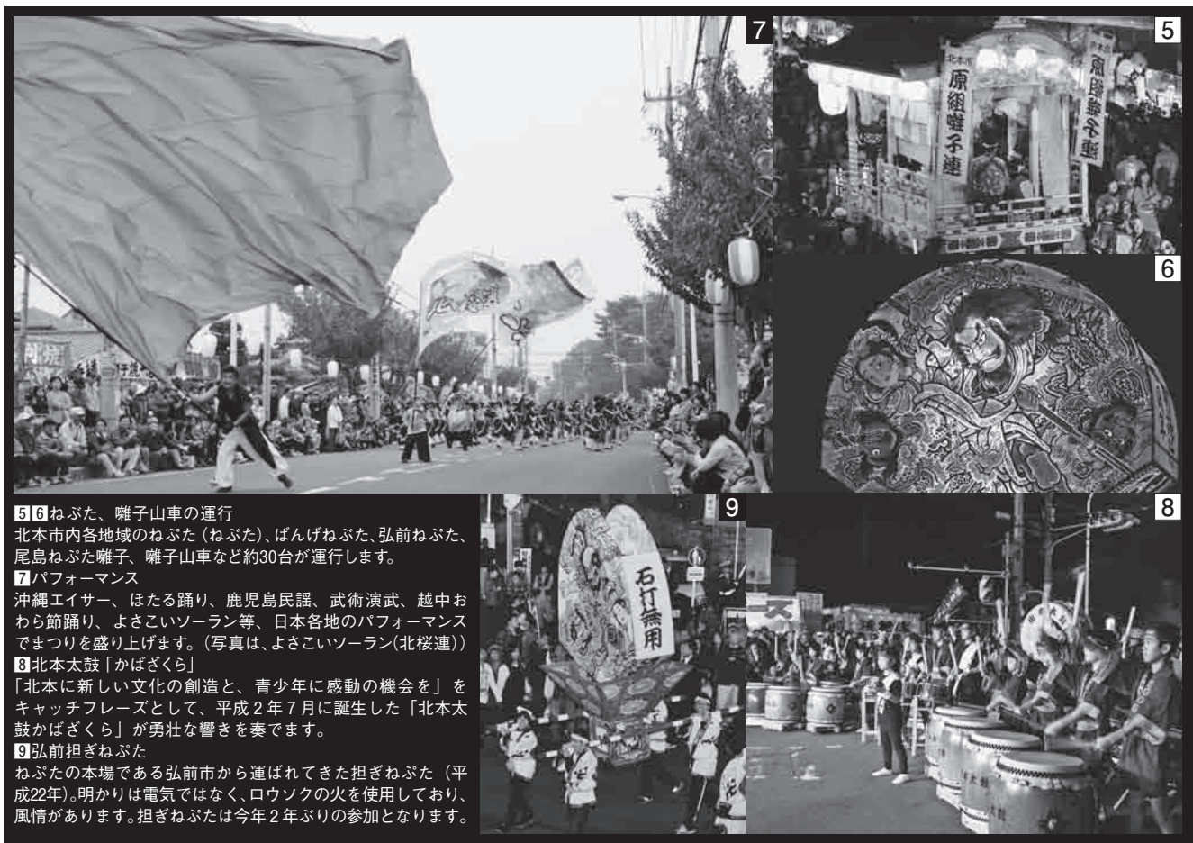
5 ねぶた、囃子山車の運行 北本市内各地域のねぶた（ねぶた）、ぼんげねぶた、弘前ねぶた、尾島ねぶた囃子、囃子山車など約30台が運行します。 7 パフォーマンス 沖縄エイサー、ほたる踊り、鹿児島民謡、武術演武、越中おわら節踊り、よさこいソーラン等、日本各地のパフォーマンスでまつりを盛り上げます。（写真は、よさこいソーラン（北桜連）） 8 北本太鼓「かばざくら」 「北本に新しい文化の創造と、青少年に感動の機会を」をキャッチフレーズとして、平成2年7月に誕生した「北本太鼓かばざくら」が勇壮な響きを奏でます。 9 弘前担ぎねぶた ねぶたの本場である弘前市から運ばれてきた担ぎねぶた（平成22年）。明かりは電気ではなく、ロウソクの火を使用しており、風情があります。担ぎねぶたは今年2年ぶりの参加となります。

「ねぶた」と「ねぶた」どちらも源は同じですが、なまりの違いから分かれたものと思われまます。昔の文献を見ると「ねぶた」だったり、「ねむた」だったり呼び名が定まっていませんでしたが、弘前市の「ねぶた」、青森市の「ねぶた」というように、地域の差別化を図る目的もあつたようです。