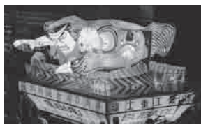
平成23年「ばんげねぶた」