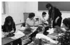
フラワーアレンジメント講座

※その他、理事会(毎月1回)、市民教授会(年1回)、市民教授研修会(年1回)、定期総会(年1回)、新規市民教授説明会(年2回)の開催 ※講座数、受講者数は平成24年11月15日現在です。