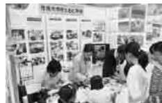
学びピア埼玉2009へ参加