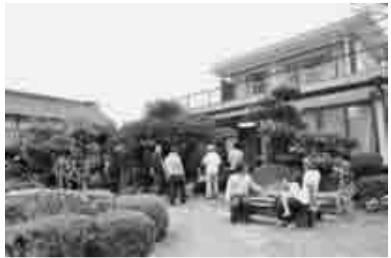
▲きたもとアトリエハウス外観

時 2月23日(土)・24日(日) 10:00~17:00 内 母屋でのカフェ出店、ギャラリーでのパッチワーク作品販売