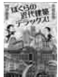
ぼくらの近代建築 デラックス! 万城目学/門井慶喜 (文藝春秋)