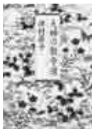
夫婦の散歩道 津村 節子 (河出書房新社)